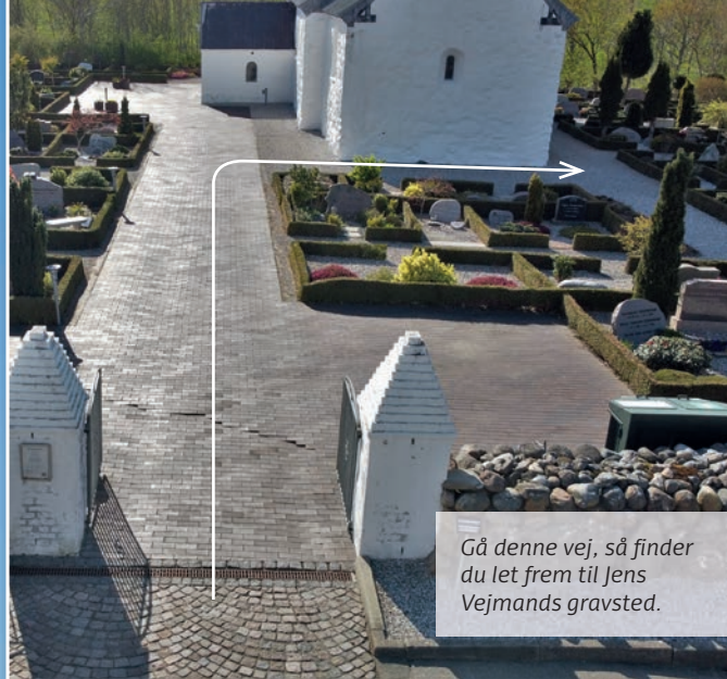
Gå denne vej, så finder du let frem til Jens Vejmands gravsted.