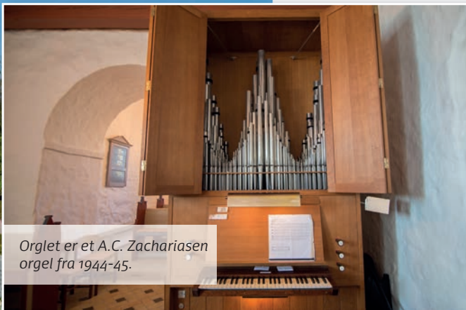
Orglet er et A.C. Zachariasen orgel fra 1944-45.