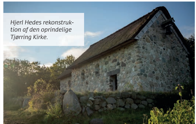
Hjerl Hedes rekonstruktion af den oprindelige Tjørring Kirke.