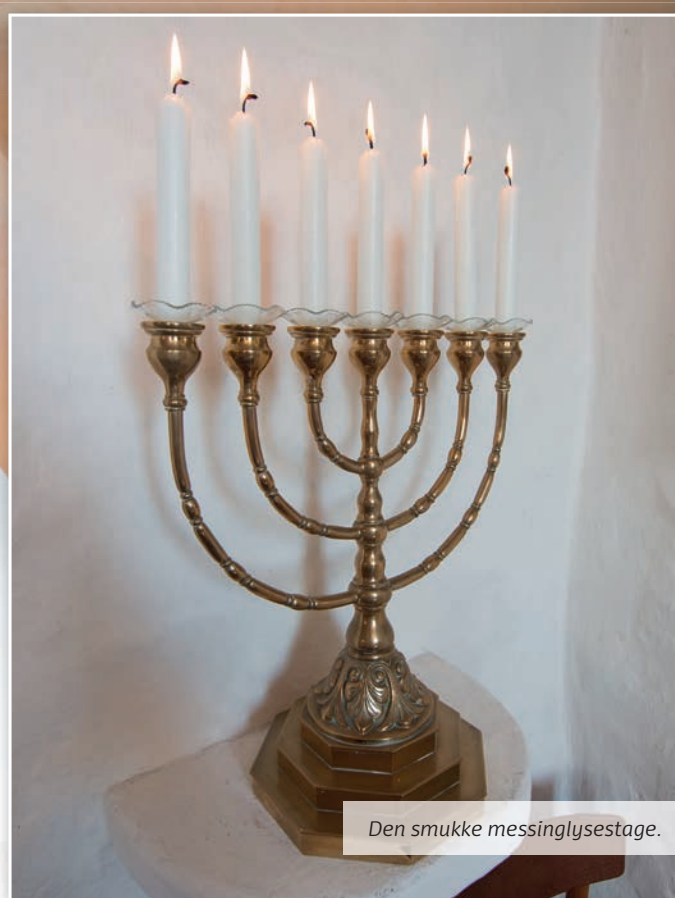
Den smukke messinglysestage.