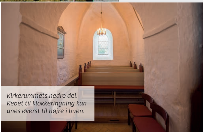
Kirkerummets nedre del. Rebet til klokkeringning kan anes øverst til højre i buen.