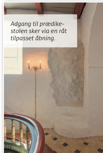
Adgang til prædikestolen sker via en råt tilpasset åbning.