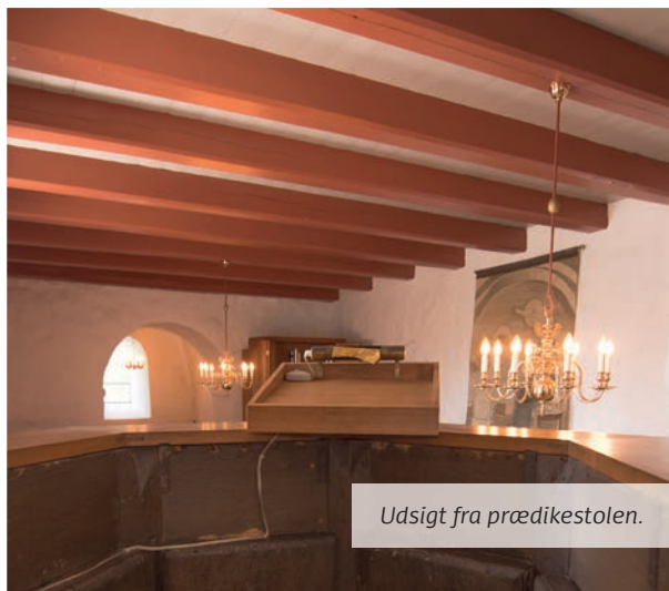
Udsigt fra prædikestolen.

Oprindeligt har den ikke været bemalt før 1850, hvor sandsynligvis også teksten er tilføjet, og den nuværende bemaling sker ved restaurering i 1936.