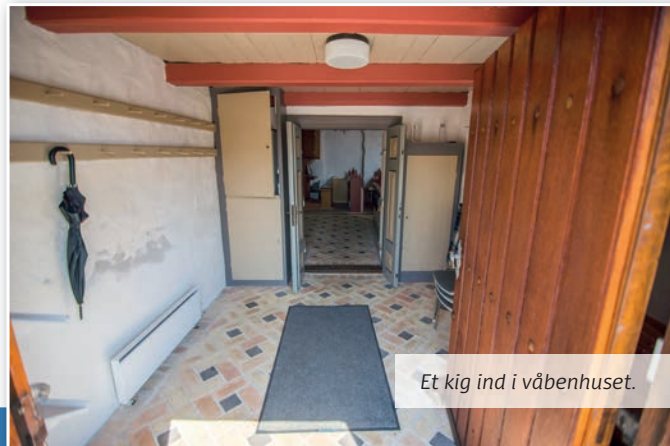
Et kig ind i våbenhuset.

I 1800 erstatter det eksisterende våbenhus tidligere tiders våbenhus i bindingsværk.