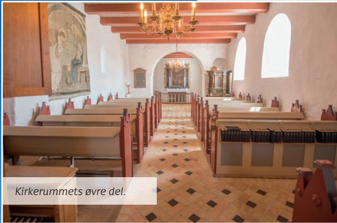
Kirkerummets øvre del.

På Frilandsmuseet Hjerl Hede findes en rekonstruktion af Tjørring Kirke, som den oprindeligt så ud i 1100-tallet.